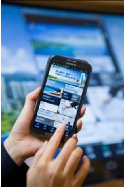
格力海岸业主通过专属 APP 系统享受物业便捷服务