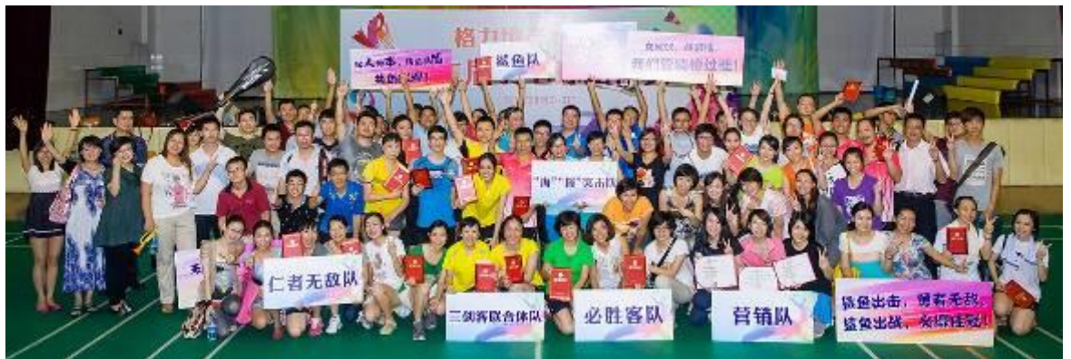
2013 年度格力地产员工羽毛球比赛