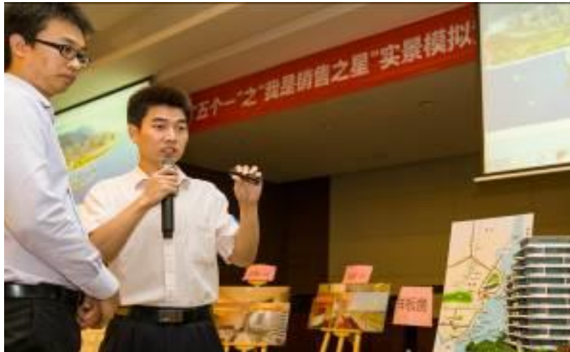
“我是销售之星”风采大赛