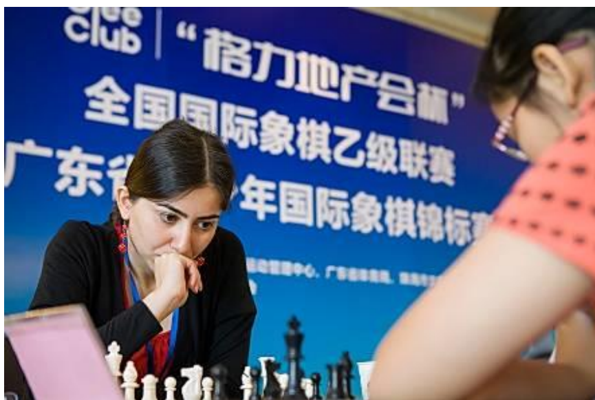
“格力地产会杯”全国国际象棋乙级联赛