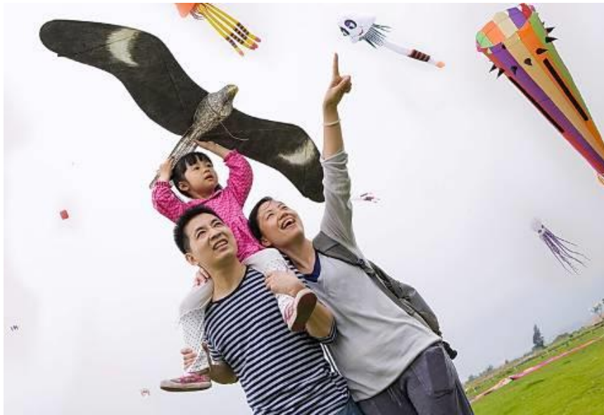
珠海首次国际风筝节

2013年，公司先后赞助和承办了“广东省青少年国际象棋锦标赛”、“全国国际象棋乙级联赛”、“珠海首次国际风筝节”、“快乐骑行、浪漫珠海”绿色公益千人骑行活动、“跨界——交响乐与弗拉门哥”新年音乐会等活动，还组队参与“珠海半程马拉松赛”等多项文体活动，为城市的体育事业及社会文化建设做出了积极的贡献。