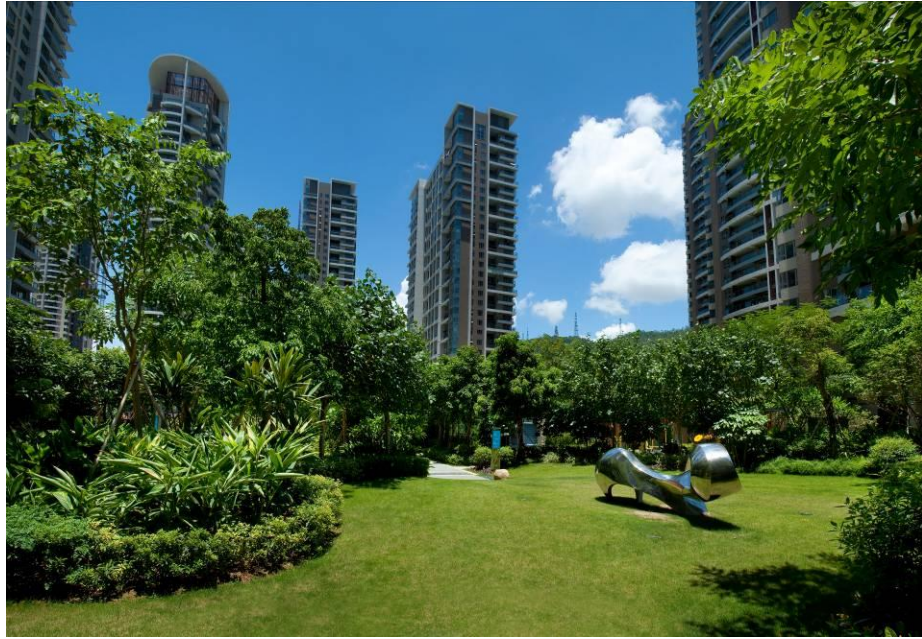
格力广场项目荣获“广东省绿色住区金奖”