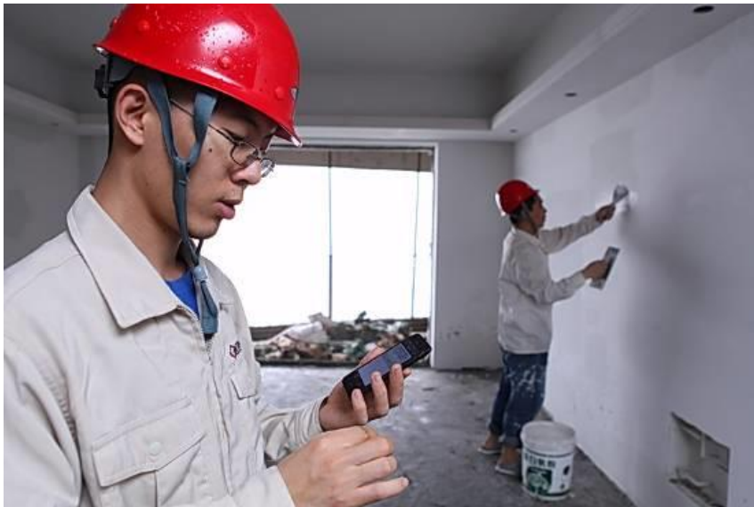
工作人员通过自主研发的项目软件对工程进行实时监控

2013年上半年，公司通过技术创新和软件开发，开创移动终端应用于工程现场管理的新尝试，实现工程项目现场管理工作与信息收集工作同步，极大地提高了信息的及时性及管理的有效性。