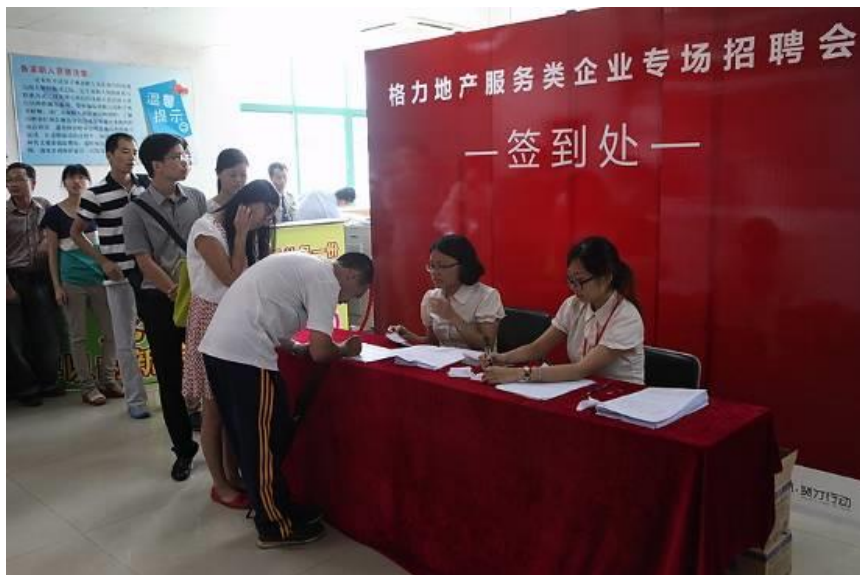
格力地产专场招聘会

近几年公司通过校园招聘、社会专场招聘，吸纳了一大批专业人才和精英，保障了公司的持续健康发展，缓解了社会就业压力。据统计，2013年，格力地产共计新入职员工247人。