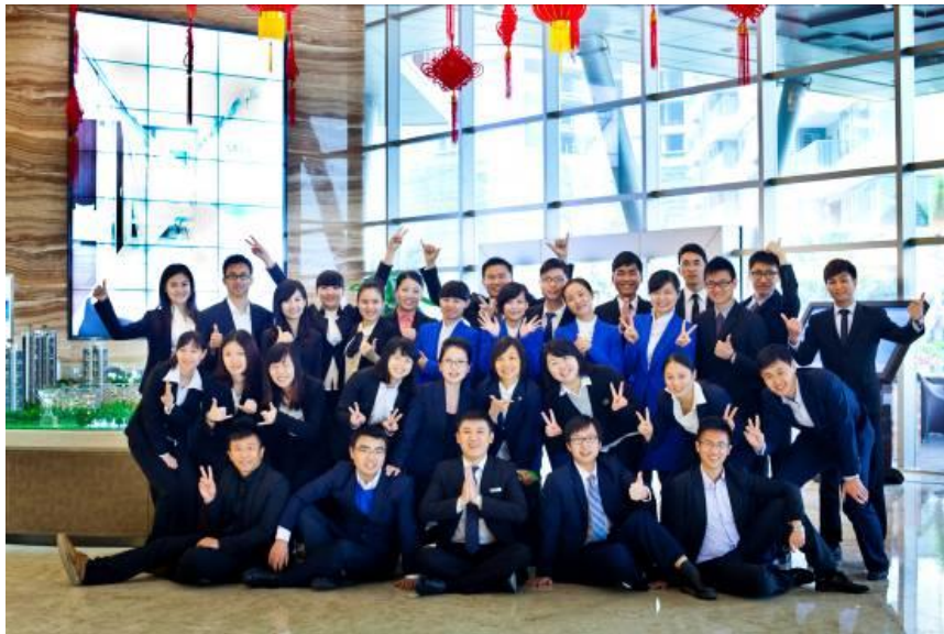
格力海岸销售团队