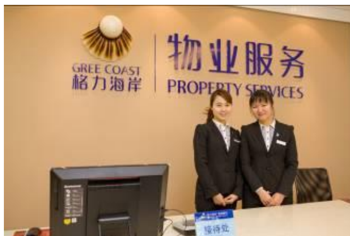
主动热情的管理人员