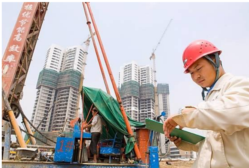
格力海岸项目工作人员进行现场监管

格力地产坚持“精品战略”，在产品打造和项目管理过程中，全程细化、标准化，对于规划、设计、施工、建造等各个环节形成管理链条，全面保障工程的施工质量。