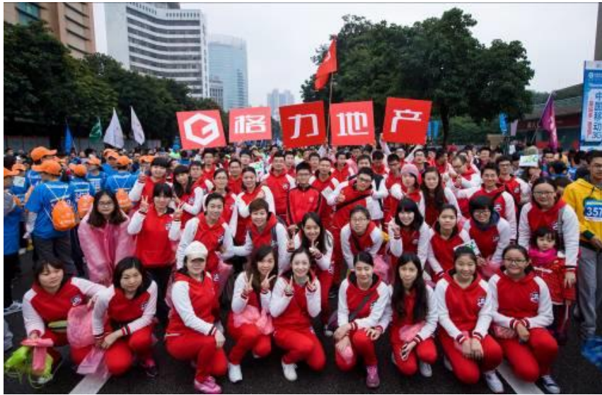
格力地产方队参加珠海半程马拉松比赛