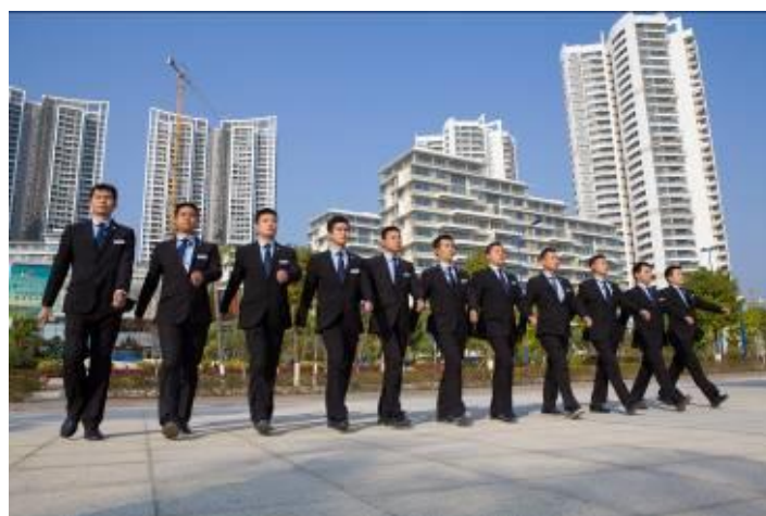
训练有素的保安队伍